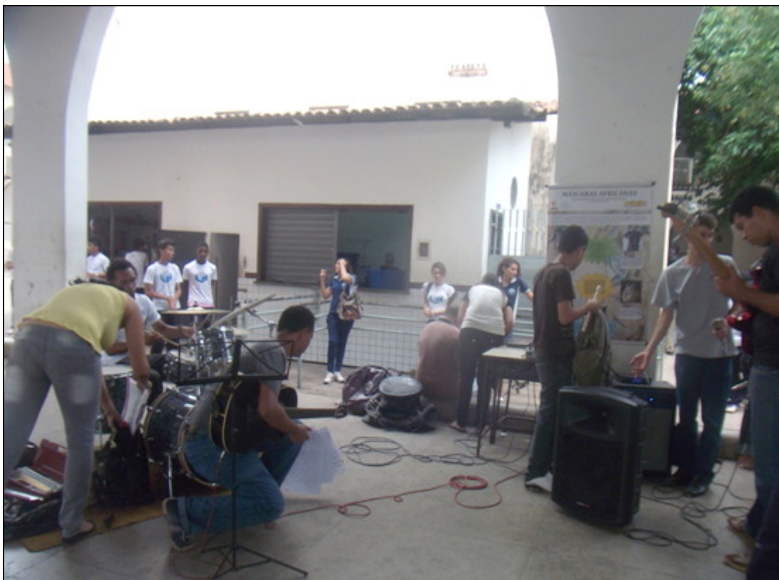
Fig. 4 – Atividade prática de Artes Visuais realizada no COLUN

A imagem em seguida ilustra as preparações para uma apresentação musical no COLUN (fig. 4):