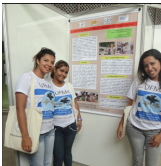
Fig. 5 – Pôster apresentado no III Encontro Nacional das Licenciaturas pelos bolsistas licenciandos em Artes Visuais

É importante reforçar que a temática da Cultura Afro-Brasileira chamou a atenção de membros de outras Universidades, segundo relatos dos bolsistas.