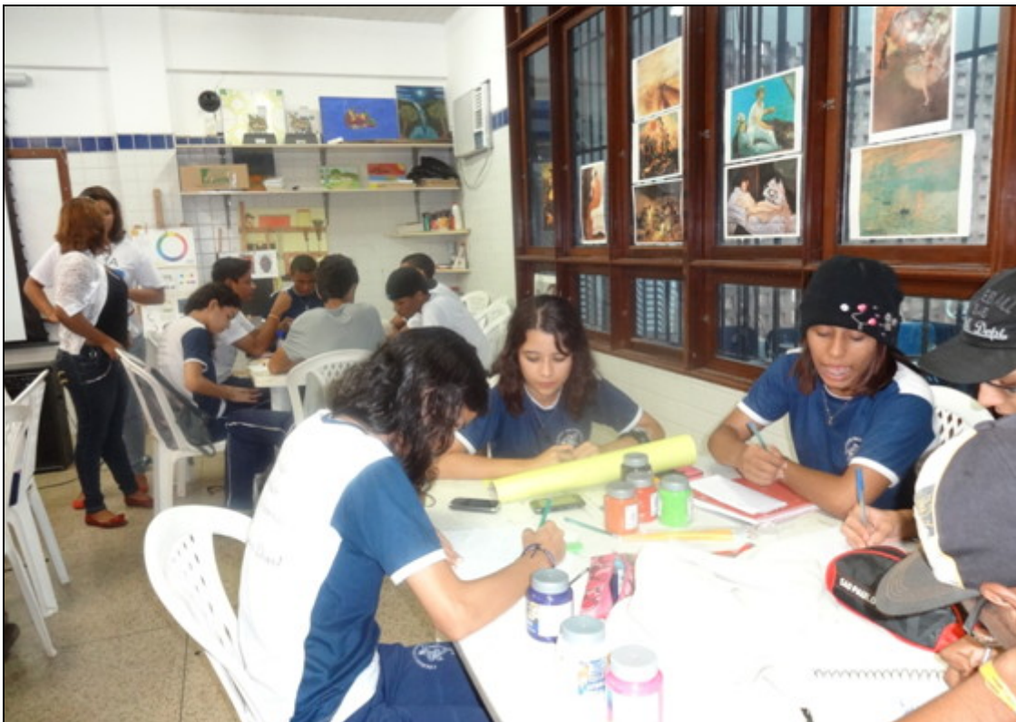
Fig. 3 – Atividade prática de Artes Visuais realizada no COLUN

A seguir, há uma imagem de atividade de Artes Visuais realizada no COLUN (fig. 3):