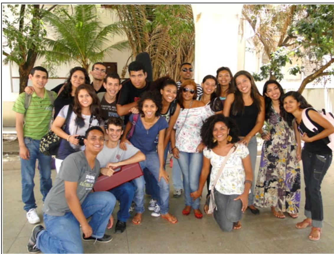
Fig. 1 – Bolsistas do Subprojeto de Artes (2012/2º) em frente ao Liceu Maranhense

Diante deste cenário, reitero que o presente relatório será elaborado essencialmente com base no breve diagnóstico realizado e nos relatos dos bolsistas que, por motivos particulares da condução deste subprojeto, não pude acompanhar de forma efetiva.